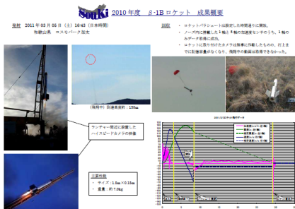
小型実験ロケット (和歌山県 加太)